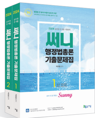
* 24 기출문제집 _ 25대비 개정판 출간 예정