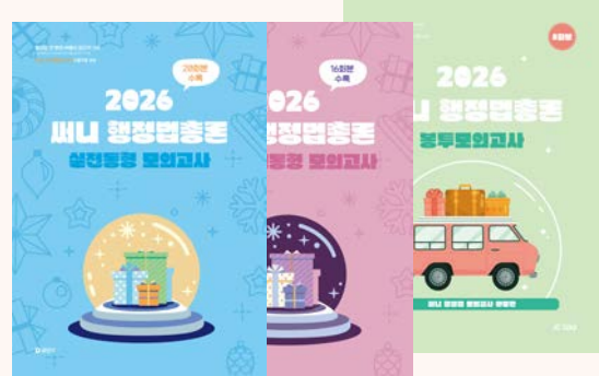
상기 이미지는 26년 교재 표지입니다. (27년 개정판 출간 예정)