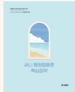
상기 이미지는 26년 교재 표지입니다. (27년 개정판 출간 예정)

핵심집약은 행정법총론의 내용은 빠짐없이 수록하되, 이론과 기출지문(OX) 회독이 용이하도록 수험생의 눈높이에 맞춰 압축 요약한 단권화 최적의 회독용 교재입니다.