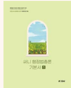
상기 이미지는 26년 교재 표지입니다. (27년 개정판 출간 예정)

가장 중요하고 필수적으로 수강해야 할 연구소 강력추천 강의 이니 꼭 수강해 주세요. 써니쌤의 같고 님은 강의력의 경수를 느낄 수 있을 거예요.