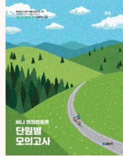
상기 이미지는 26년 교재 표지입니다. (27년 개정판 출간 예정)

단원별 모의고사로 취약 단원을 확인하고 보완하여 완벽한 이론을 만들어 보세요.