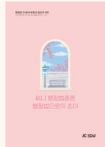
상기 이미지는 26년 교재 표지입니다. (27년 개정판 출간 예정)

대부분의 수험생은 법에 대해 무지한 상태로 시작하기 때문에 법률용어가 가장 큰 장벽입니다. 생소하고 외계어 같은 법률용어만 익숙해져도 행정법의 진입 장벽이 훨씬 낮아지게 됩니다. 써니쌤 특유의 스토리텔링 방식으로, 강의만 수강해도 저절로 이해와 암기가 되는 효과를 느낄 수 있을 거예요.