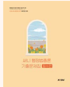
상기 이미지는 26년 교재 표지입니다. (27년 개정판 출간 예정)

★ 기출문제와 핵심집약을 병행한다면 좀 더 입체적인 학습을 할 수 있음.